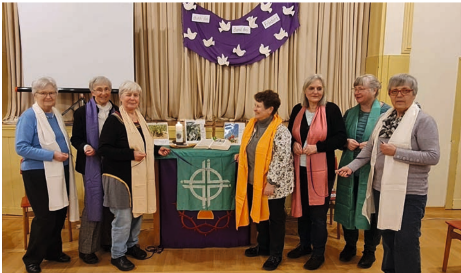
Die Vorbereitungsgruppe 2024

In Eutritzsch lädt der Frauengesprächskreis 19.30 Uhr in den Gemeindesaal ein.