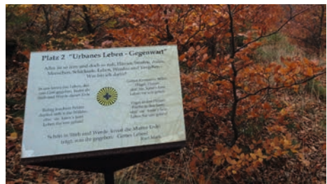
Marti-Gedicht in Bad Harzburg

In das Evangelische Gesangbuch wurde in der Vertonung von Winfrid Heurich ein Text aufgenommen, welcher sich auf das 21. Kapitel der Offenbarung des Johannes bezieht: „Der Himmel, der ist, ist nicht der Himmel, der kommt.“ Deutlich wird ein starker Glaube