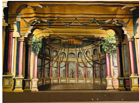
Die Bühne des Ekhof-Theaters

Eine wahre Kostbarkeit ist das Ekhof-Theater von 1683, eines der wenigen erhaltenen Barocktheater in Europa. Herzog Friedrich I. ließ