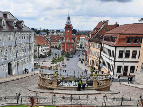
Blick zum Markt