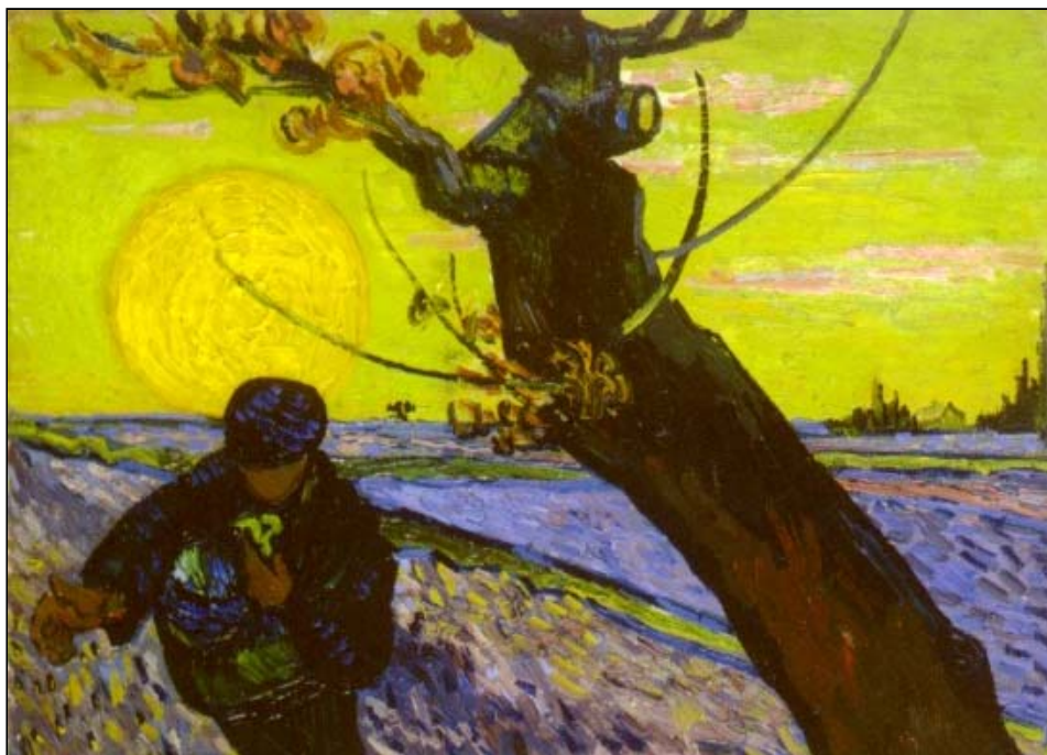
Vincent van Gogh: Sämann