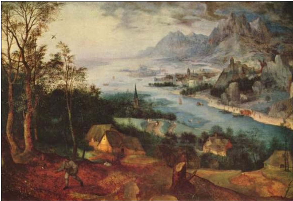
Pieter Bruegel: Flusslandschaft mit Sämann