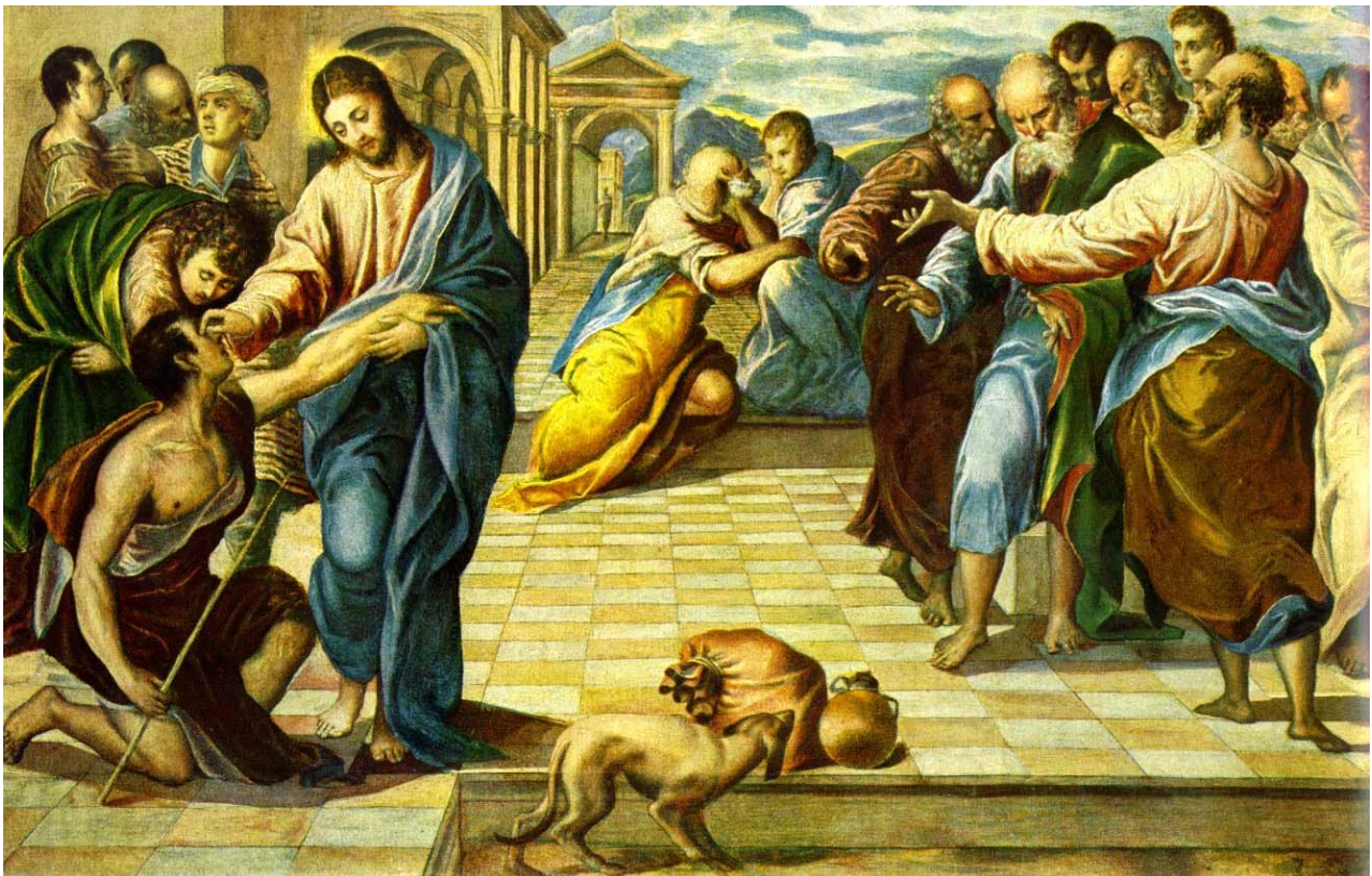
El Greco; Heilung des Blindgeborenen

Solange ich in der Welt bin, bin ich das Licht der Welt. Als er das gesagt hatte, spuckte er auf die Erde, machte daraus einen Brei und strich den Brei auf die Augen des Blinden. Und er sprach zu ihm: Geh zum Teich Siloah - das heißt übersetzt: gesandt - und wasche dich! Da ging er hin und wusch sich und kam sehend wieder.